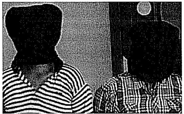
איימו על הערב וחטפו את החייב (אילוסטרציה)

צעיר שלקח הלוואה על בסיס החודר שבועי של הריבית והתקשה לעמוד בתשלומים שמע איך איימו וסחטו כספים מתברר שהיה ערב לו, עד שנחטף בעצמו לשלושה ימים על ידי נשיו אשר היכו אותו עם מקלות מטאטא ושברו את שיניו * כתב אישום בדרך