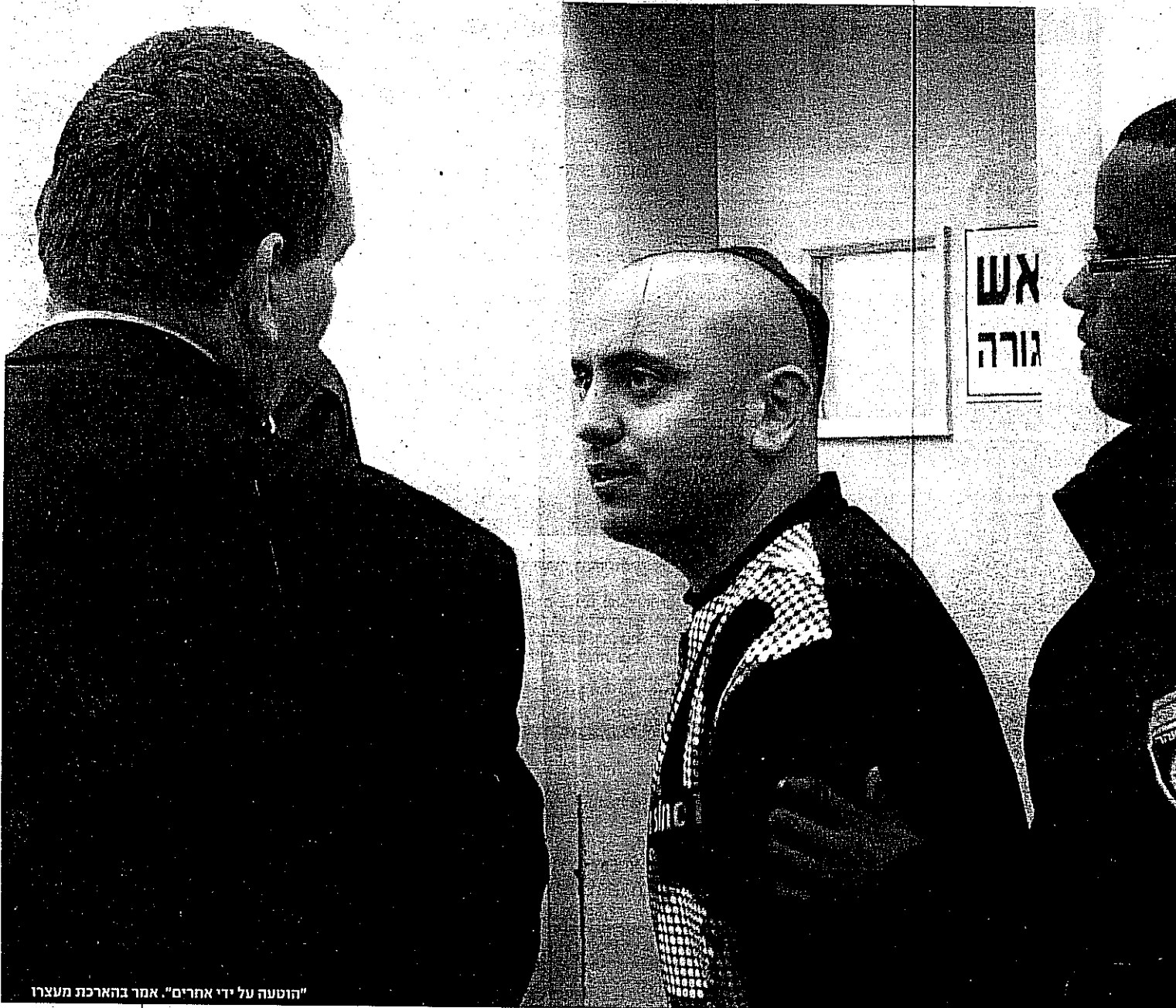
"הוטעה על ידי אחרים". אמר בהארכת מעצרו