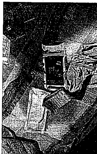
מכוניתו של אמר ששימשה למכירת הסם

"זו הייתה תקופה אפורה, לא היה לי מה לעשות. לפני כמה חודשים עברתי טסט ויש את התקופה של המלווה בנהיגה. רק רציתי שהתקופה הזאת תיגמר אז סתם התחלתי לעשן פה ושם"