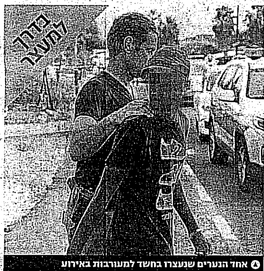
אחד הנערים שנעצרו בחשד למעורבות באירוע

מילה מטופשת שנזרקה לעבר צעירה הציתה תגרת דמים: 2 הרוגים ופצועים • עובר משפחת אחד הנרצחים, מדובר בטרנדריה שנייה; לפני שנתיים רצח האח את אבי המשפחה